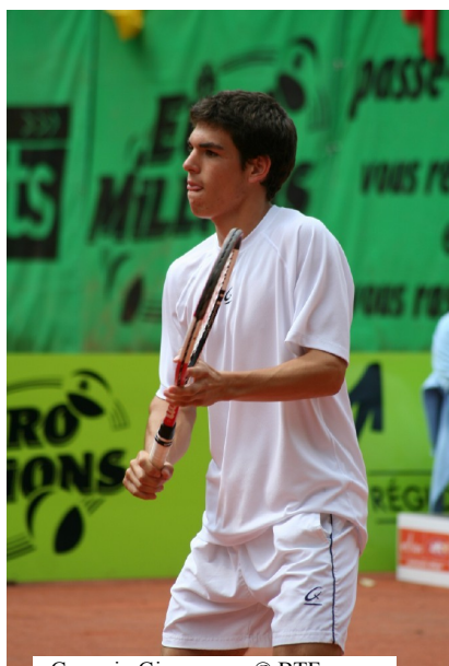
Germain Gigounon

We willen ook nog vermelden dat de "Ethias Trophy" zal plaats hebben in Bergen van 1 tot 7 oktober. Dominique Monami werd trouwens aangesteld als toernooirectrice.